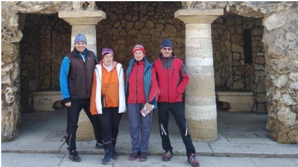
И где мы только ни бывали...

нашей республики. На эти официальные старты российского календаря заявилось более 2000 человек. Многие уже были на южных берегах, когда грянул запрет на все спортивные соревнования. Собравшиеся и оставшиеся несколько сотен лесных скороходов довольствовались практически тренировочным режимом, а по возвращении двухнедельной самоизоляции.