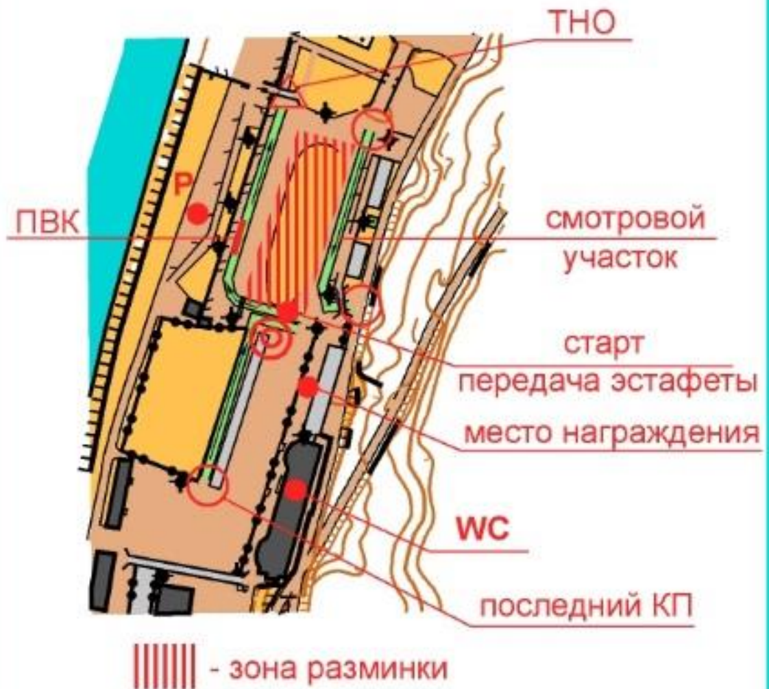
Схема арены соревнований Кросс-эстафета-3 человека 30.07.2023 г.