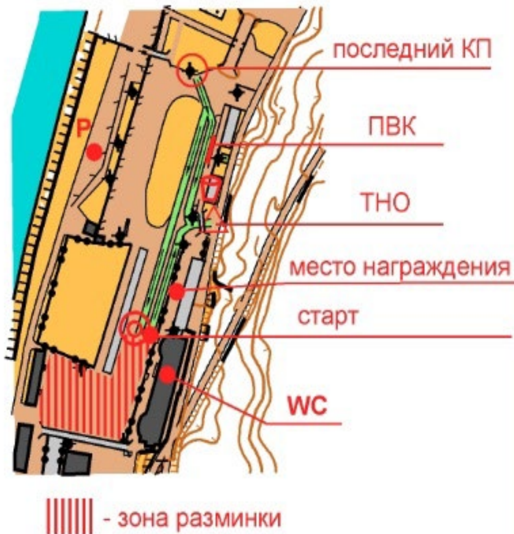
Схема арены соревнований Кросс-лонг 26.07.2023 г.