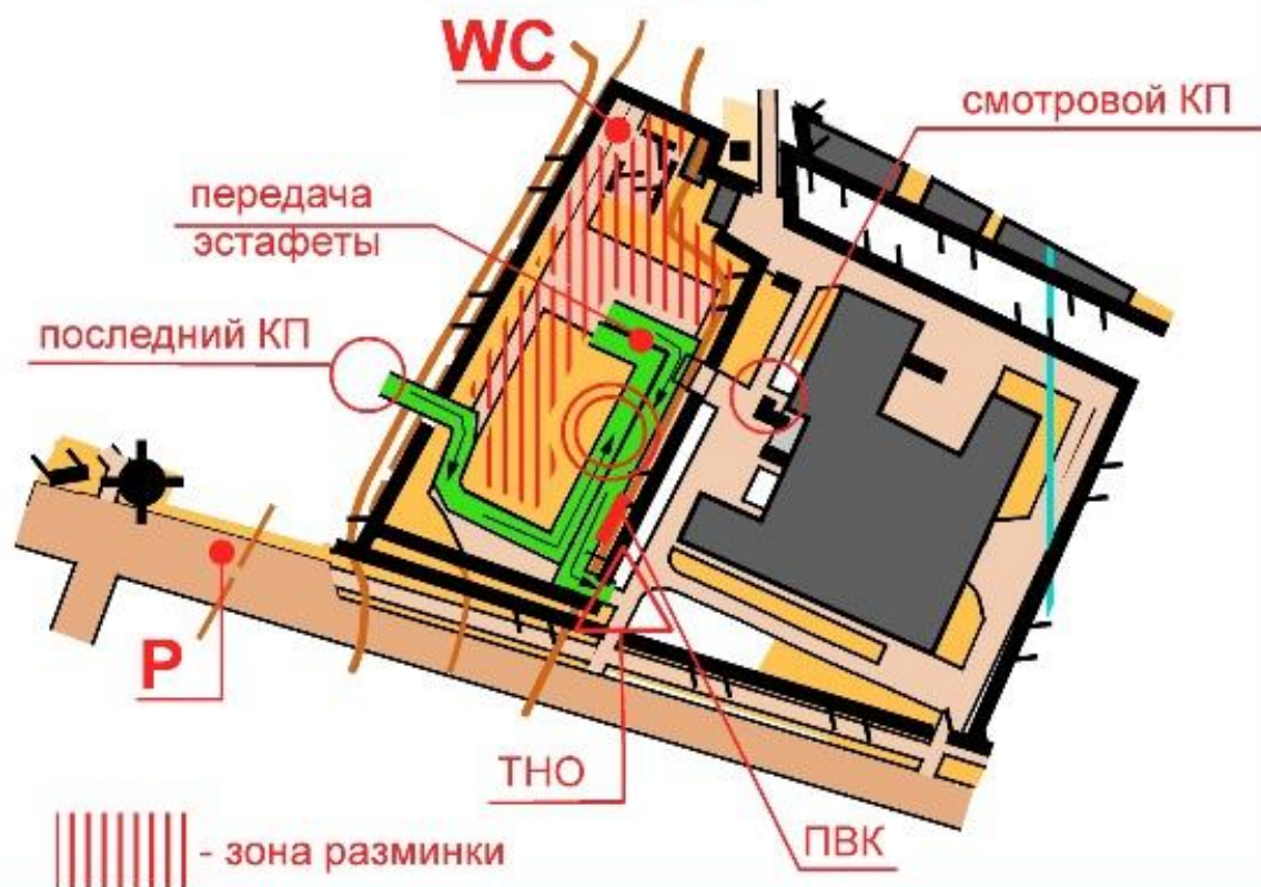
Схема арены соревнований Кросс-эстафета-4 чел.(2м+2ж) 29.07.2023 г.