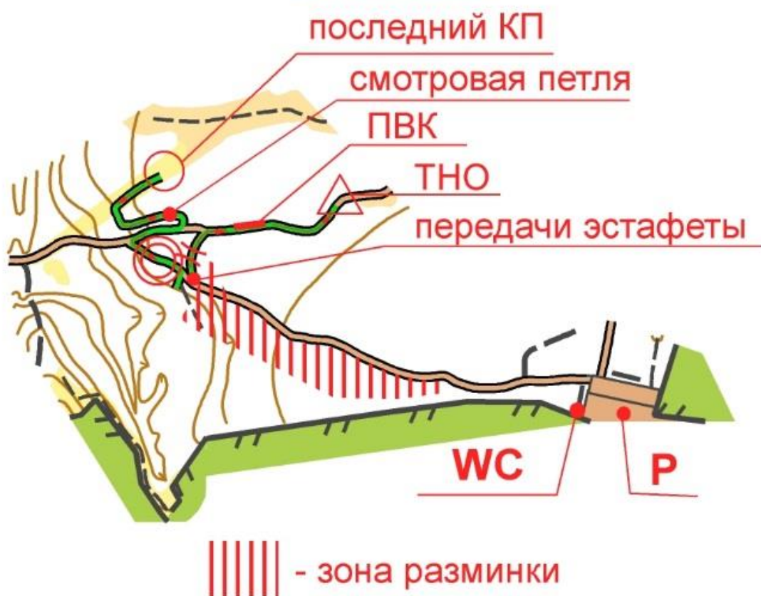
Схема арены соревнований Кросс-эстафета-2 чел.(1м+1ж) 28.07.2023 г.