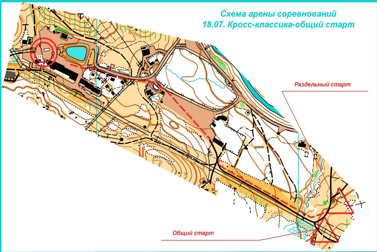
Схема арены соревнований 18.07. Кросс-классика-общий старт